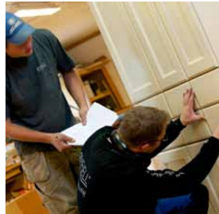
Etterbehandling, finish og kvalitetskontroll