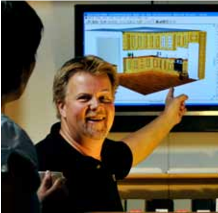
Samtale og avklaringer med kunde