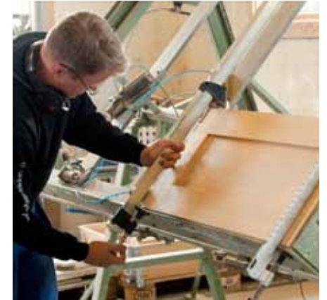
Bearbeidelse og produksjon