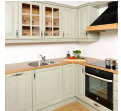
Ferdig innredning klar til bruk